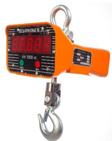
Рисунок 2. Общий вид весов крановых OCS

Общий вид весов представлен на рисунке 2.